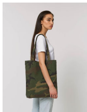
Tote Bag AOP