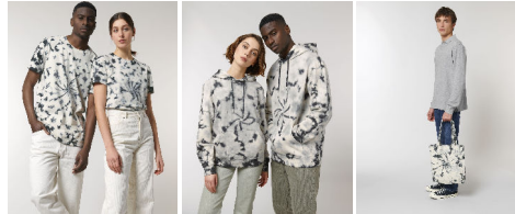
Creator Tie and Dye