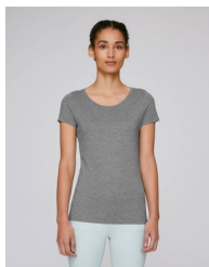
Stella Loves Modal