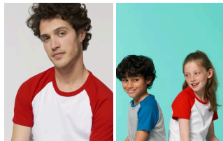
Catcher Short Sleeve Mini Catcher Short Sleeve