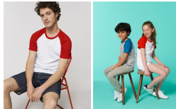
Catcher Short Sleeve Mini Catcher Short Sleeve