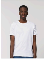
Shopping Bag AOP