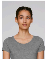
Stella Loves Modal