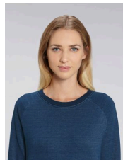
Stella Tripster Denim