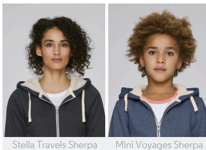
Stella Travels Sherpa