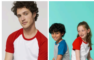
Catcher Short Sleeve Mini Catcher Short Sleeve