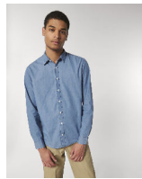
Stanley Innovates Denim

Shell : Tessuto denim , 100% cotone biologico filato e pettinato , Capo lavato , Yarn Dyed , 170 GSM