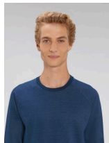
Stanley Stroller Denim